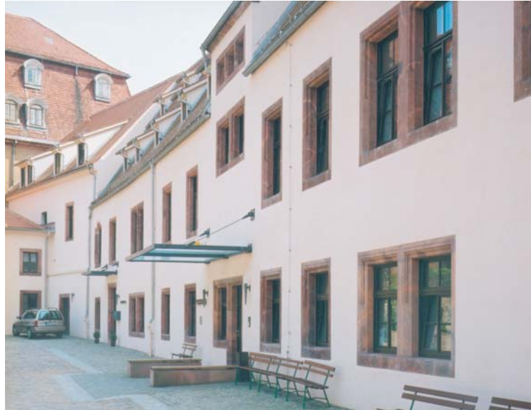
Ansicht sanierter Innenhof

Schmiedestraße 14 . 04229 Leipzig . T: 0341 - 48425-0 . Fax: 0341 - 48425-28 . e: info@staupendahl.de . i: www.staupendahl.de