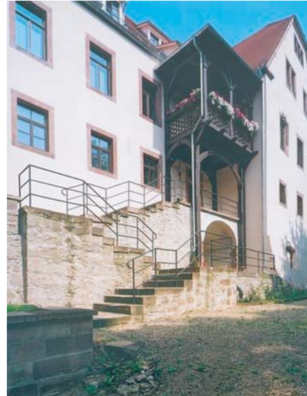
Ansicht von Süden - Sanierte Balkonanlage und instandgesetzte Stützmauer